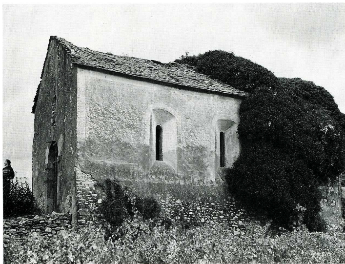
Roquebrun (Hérault). Chapelle Saint-Poncian de Baraussan.

Hérault, canton d'Olargues, arrond. de Béziers, 550 hab.