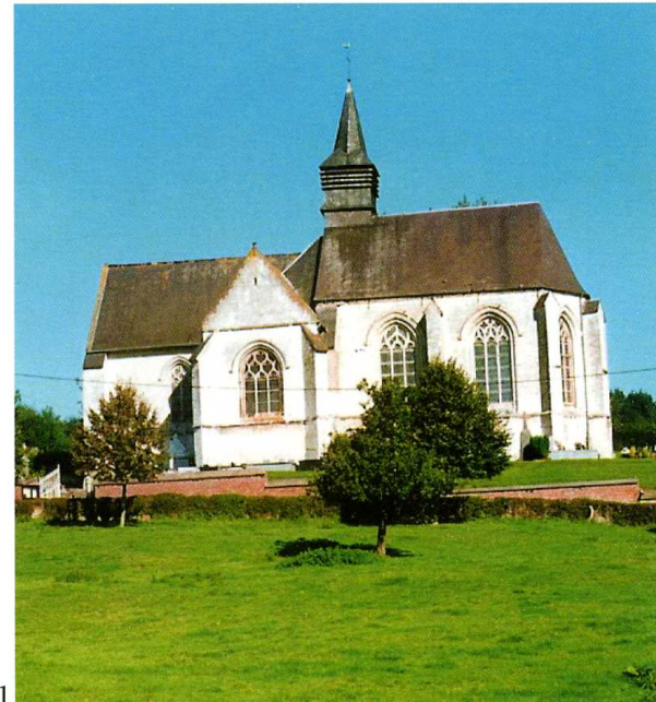
1 Royon (Pas-de-Calais) Église Saint-Germain 1. Façade sud (cl. J.-Fr. de Bournonville) 2. Contreforts de la chapelle sud (cl. J.-Fr. de Bournonville) 3. Vue intérieure vers l'abside (cl. J.-Fr. de Bournonville)

Bâtie sur le flanc de la vallée de la Créquoise, dans un site ravissant, l'édifice domine le village. Le plan en croix latine comprend une nef de deux travées, flanquée au nord et au sud de chapelles formant transept, et un chœur terminé par un chevet à trois pans. Au nord, dans l'angle formé par la chapelle et le chœur, une tourelle d'escalier de plan polygonal conduit au clocher assis sur le pignon du chœur. Une sacristie bâtie en 1893 s'appuie contre le flanc nord du sanctuaire. Le mur ouest, visiblement remanié dans ses parties basses, est aveugle. On pénètre dans l'église par une porte en anse de panier percée dans le mur méridional du vaisseau. Le chœur possède un accès identique mais couronné cette fois par une archivolte retournée. L'intérieur est généreusement éclairé par de grandes baies à deux ou trois lancettes. De fausses voûtes d'ogives ont remplacé dans les années 1860 l'ancien couvrement. Seules les chapelles ont conservé leurs croisées d'ogives originelles. Dans le chœur, de belles niches pourvues de consoles et de dais très ouvragés recevaient les retombées des voûtes. Le matériau de