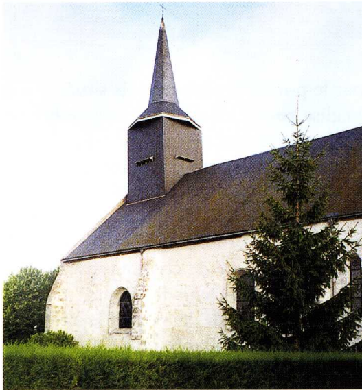
Ruan (Loiret) Église Saint-Félix 1. Nef et clocher, côté sud 2. Chevet 3. Porte occidentale 4. Plan (G. Trouvé, arch.)