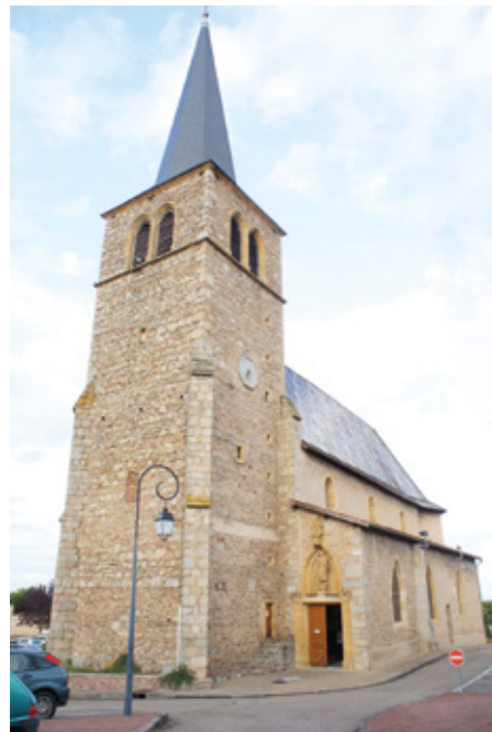
1. Façade sud-ouest

Canton Renaison, arrondissement Roanne, 1961 habitants ISMH 1963