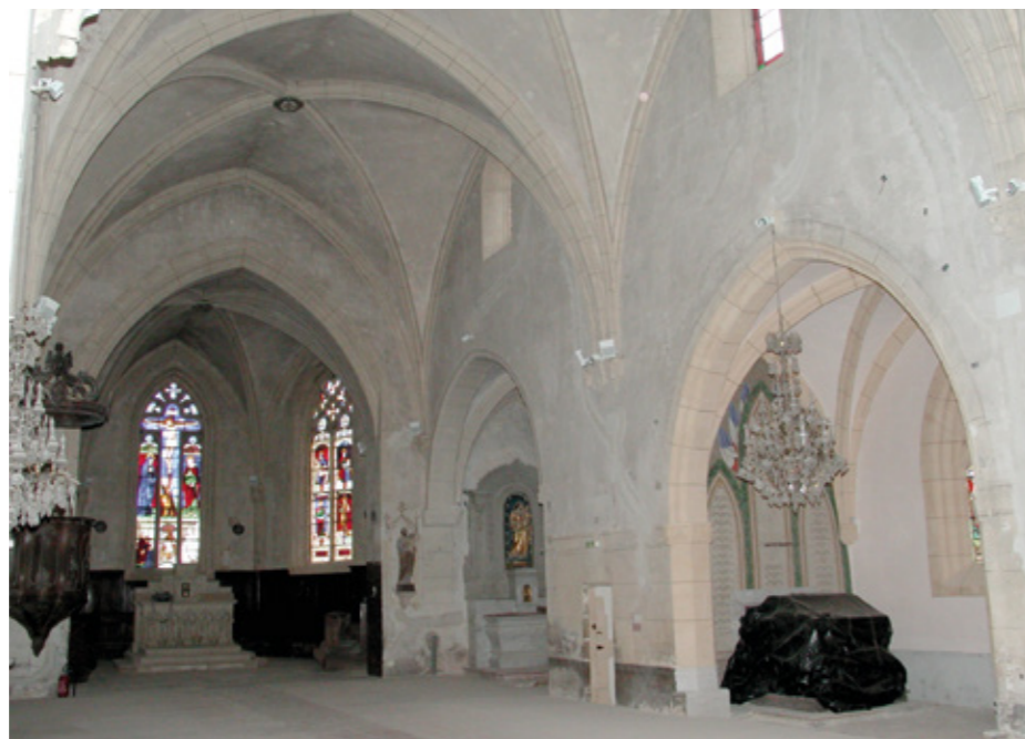
3. Vue de la nef avant les travaux

Le plan d'origine était rectangulaire, avec un chevet plat et une tour-clocher à l'ouest. Cette tour eut certainement une fonction de défense, puisqu'il n'y avait, jusqu'au XIX e siècle, qu'une seule issue par l'église. « Brisé et mis en pièces » lors de la guerre de Cent Ans, la tour fut rebâtie et rehaussée en 1361. Elle s'élève à 42,70 m et comporte des baies jumelées sur ses quatre faces pour la chambre des cloches.