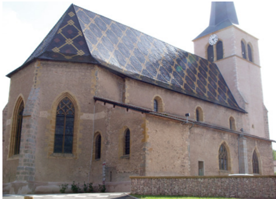
2. Façade nord-est

Située sur la côte roannaise, à 12 km à l'ouest de Roanne, Saint-André-d'Apchon était une seigneurie du comté de Forez, ayant appartenu à la famille de Lespinasse puis aux Albon. L'ÉGLISE PAROISSIALE SAINT-ANDRÉ est citée en 1166 dans une charte de Louis VII confirmant à Cluny les biens du prieuré voisin d'Ambierle. Le village possédait aussi une chapelle dédiée à sainte Catherine, dite « église-mère » dans le compte rendu de la visite pastorale de 1695. Cette chapelle, dont il subsiste une fenêtre romane, est aujourd'hui une maison d'habitation.