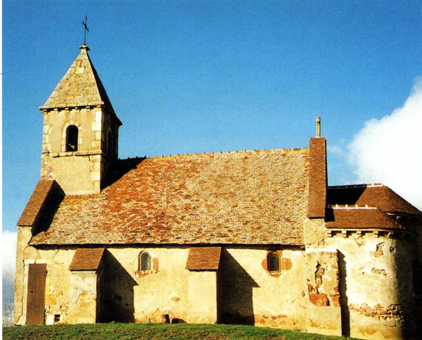
Saint-Désiré (Allier) Chapelle Sainte-Agathe 1. La chapelle côté sud 2. Chevet