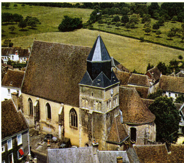
Saint-Germain-de-la-Coudre (Orne) Église Saint-Germain-d'Auxerre Vue générale sur l'église, du côté sud

De l'édifice roman subsistent le clocher carré massif, orné en partie haute d'une arcature aveugle, ainsi que le chœur et l'abside semi-