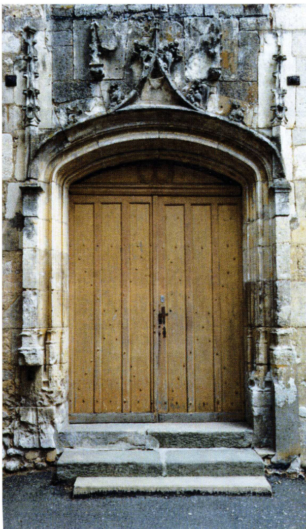
Saint-Germain-de-la-Coudre (Orne) Église Saint-Germain-d'Auxerre 1. Porte de la façade occidentale