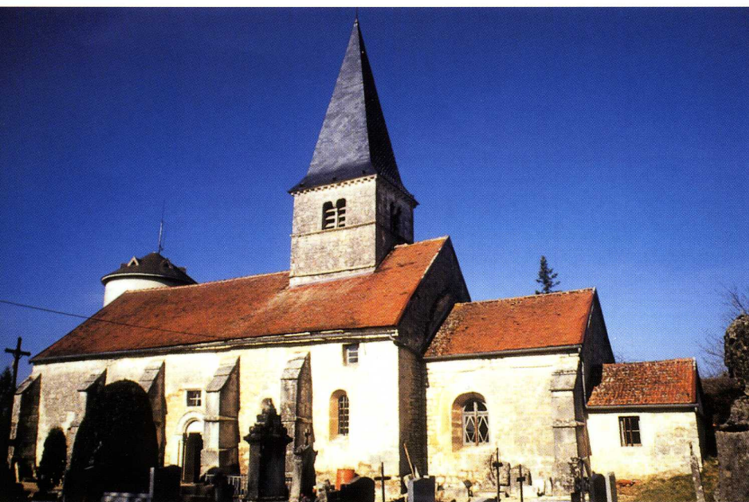
Saint-Germain-le-Rocheux (Côte-d'Or) Église Saint-Germain d'Auxerre 1. Façade sud

La porte latérale sud, de style roman, est cantonnée de colonnes engagées. L'arc en plein cintre est décoré de motifs géométriques, le tympan d'une croix ancrée. Les baies en plein cintre ont été pour la plupart remaniées au XVIII e siècle.