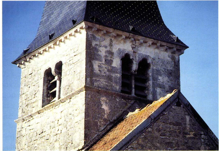
Saint-Germain-le-Rocheux (Côte-d'Or) Église Saint-Germain d'Auxerre 2. Clocher vu du sud-est 3. Plan (B. Delarozière, arch., 1996)

La nef communique avec les bas-côtés par des arcades en arc brisé reposant sur de puissants piliers chanfreinés. Le couverture est formé de voûtes en berceau plein cintre ; la première travée sous le clocher souffre d'un important dévers ; les bas-côtés sont couverts de voûtes d'arêtes. Les arcs doubleaux reposent sur des culots pyramidaux du côté de la nef et sur des piliers engagés sur les bas-côtés. On observe une disposition assez originale sur le revers du mur pignon ouest, formée par trois arcades, permettant une contrebutee intérieure.