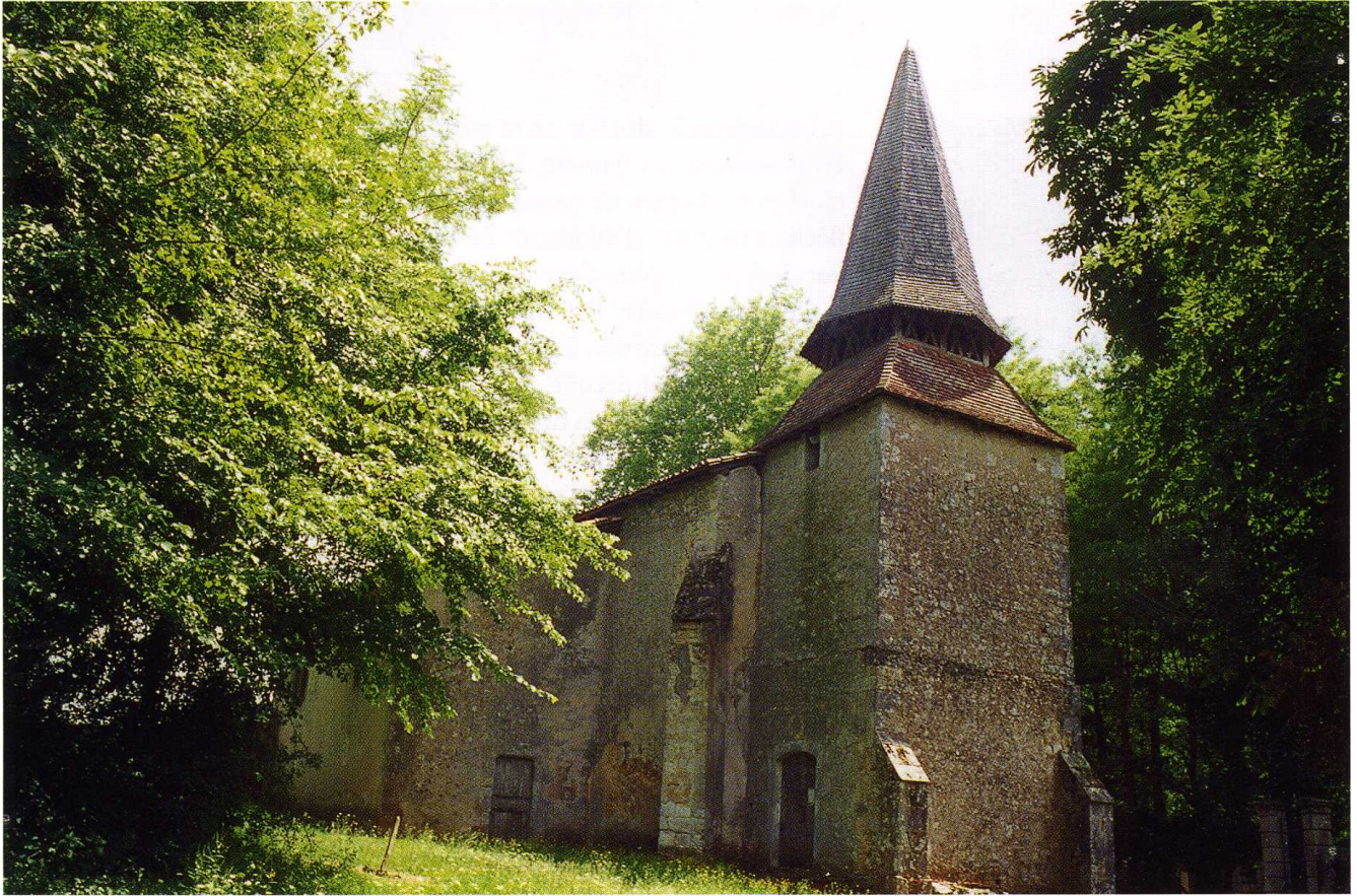
Saint-Justin (Landes) Église Sainte-Quitterie d'Argelouse 1. Clocher et façade nord 2. Plan