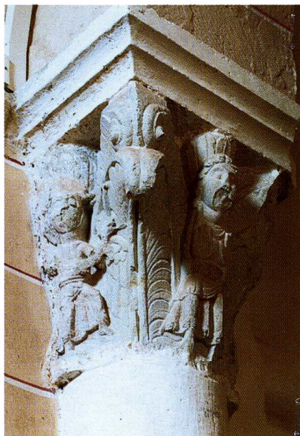
Saint-Justin (Landes) Église Sainte-Quitterie d'Argelouse Chapiteau du chœur

À l'extérieur, le clocher carré est directement coiffé d'une courte flèche en charpente octogonale, à la base de laquelle s'inscrit le beffroi des cloches ; l'absence de passage du carré à l'octogone fait de la base de la flèche une sorte d'éteignoir. Le chœur dont la hauteur est de 7,15 m paraît d'autant plus élevé qu'il est relativement étroit. Un œil-de-bœuf a été ouvert dans le mur du chevet, remplaçant une fenêtre plus ancienne condamnée. Le contrefort situé à l'articulation de la nef et du chœur au sud est décollé de la maçonnerie.