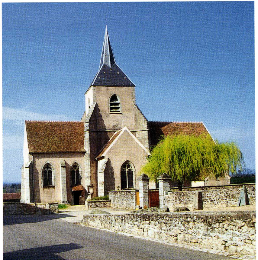
Saint-Léger-Vauban (Yonne) Église Saint-Léger 1. Vue du sud (cl. Y. Botte)

L A COMMUNE porta le nom de Saint-Léger-en-Morvan, puis de Saint-Léger-de-Foucheret, avant d'accoler en 1867 le nom du maréchal Vauban qui naquit en ce lieu en 1633. Saint-Léger fut donné par l'évêque d'Autun en 974 à l'abbaye de Vézelay, puis au XII e s. à l'abbaye de Reigny. L'église, sous le vocable de Saint-Léger, est établie sur une terrasse dominant une petite vallée ; de plan cruciforme, elle comprend une nef, un transept saillant et un chœur à chevet plat. La nef, vaisseau unique de deux travées, ainsi que la façade occidentale, ont été reconstruites en 1856, dans un style sobre néoflamboyant. Les autres parties de l'édifice sont anciennes, réalisées entre la fin du XV e et le XVI e siècle. La croisée du transept qui porte la tour du clocher est encadrée de quatre grandes arcades brisées, sans moulure, reposant sur de simples tailloirs chanfreinés, et surmontée d'une voûte d'ogives, l'ensemble étant taillé dans un granit gris. Les bras nord et sud, éclairés par une fenêtre à remplage Renaissance, sont voûtés d'ogives prismatiques en calcaire blanc. Au nord, les nervures retombent sur des