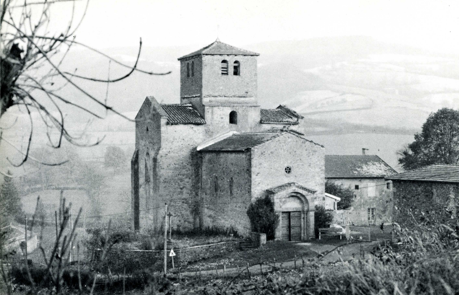
Saint-Mamert (Rhône). Ancien prieuré de Cluny.