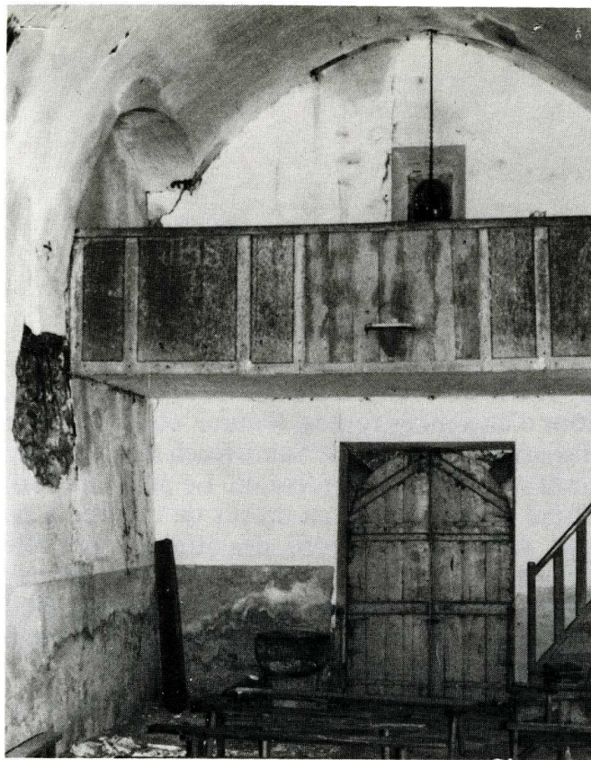
Saint-Marc-à-Frongier (Creuse). Chapelle-Roch à Montrujas.