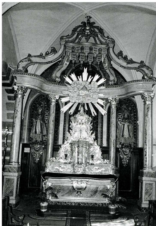
Saint-Martin-de-Bonfossé (Manche). Église Saint-Martin. Maître-autel.

mur nord de la nef, une grande arcade en arc brisé à multiples voûtures donne accès au rez-de-chaussée de la tour du clocher. De part et d'autre, les colonnes engagées portent des chapiteaux à feuillages. La chapelle du clocher est voûtée d'ogives composées d'un tore entre deux gorges. Ses murs sont scandés par des arcatures reposant sur des colonnettes dont les chapiteaux à feuillages ont conservé des tailloirs carrés, caractéristiques du début du XIII e s. en Normandie. Les fenêtres sont encadrées par des colonnettes. La flèche pyramidale a remplacé au XIX e s. la toiture en mitre du clocher dont les contre-