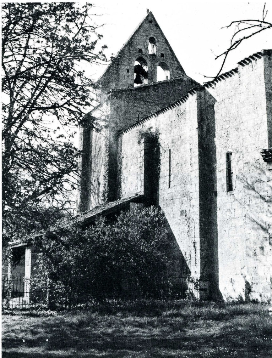
Saint-Pierre-de-Buzet (Lot-et-Garonne). Église, mur-clocher et façade sud.