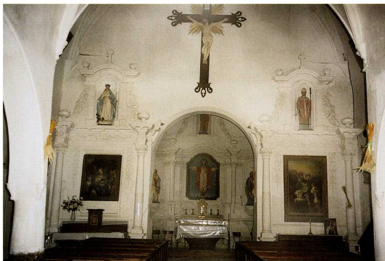
Saint-Pierre-la-Bruyère (Orne) Église Saint-Pierre Vue intérieure vers l'abside

Le mur gouttereau nord est flanqué, au contact de la façade occidentale, d'une tourelle d'escalier en brique desservant les combles.