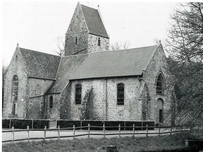
Saint-Pierre-Langers (Manche), église Saint-Pierre, vue générale.

berceau plein cintre qui couvre ce niveau s'accorderait bien avec cette fonction. Le second niveau est éclairé seulement par un petit oculus dans le mur sud, il est charpenté. La porte percée dans le mur ouest et donnant dans le vide fait penser qu'il servait de magasin de stockage. Enfin, sous le toit et descendant juste au-dessous de l'appui des petites baies en plein cintre se trouve le beffroi. L'église conserve une chaire qui porte la date de 1759. La Sauvegarde de l'Art Français a accordé en 1994 une aide de 90 000 F pour la poursuite de la réfection du clocher.