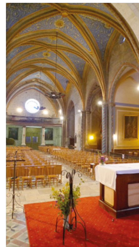
5. Vue intérieure vers l'entrée

au xx e siècle et l'exécution de reprises dans la nef. Les vitraux du xix e siècle des ateliers toulousains de Victor Gesta sont conservés, ainsi que le mobilier liturgique de la seconde moitié du siècle : maître-autel avec ciborium et pinacle surmonté de la croix, en pierre d'Arles, sculpté par Paul Espinasse, d'Albi, autels et statues des chapelles, œuvres des ateliers Virebent, de Toulouse. Des pièces anciennes (un encensoir de la fin du xvii e siècle ou du début du xviii e , deux plats de quête du xvi e siècle, ornés l'un d'une figure de saint Georges terrassant le dragon, l'autre d'une Vierge à l'Enfant, un calice et patène d'argent du xviii e siècle) constituent une sorte de petit trésor regroupé autour du coffret-reliquaire du Saint-Voile, objet composite remonté après la confiscation et la fonte du reliquaire d'origine pendant la Révolution : le coffret de bois recouvert d'argent et de nacre, aux armes de la famille des Prés et d'une autre famille non identifiée, est surmonté d'une croix d'argent portant le poinçon de la curie pontificale sous Clément VI (1342-1352), dans laquelle il faut sans doute reconnaître celle qui fut léguée au chapitre collégial de Montpezat-Quercy par le cardinal Pierre des