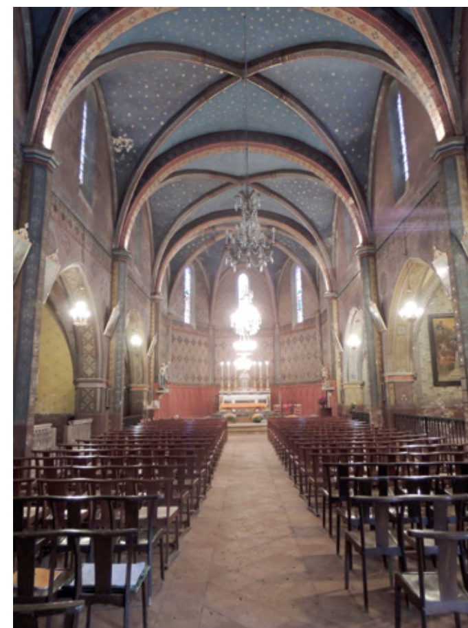
3. Vue intérieure vers le chœur