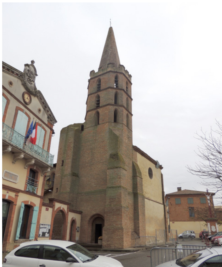
1. Façade nord-ouest