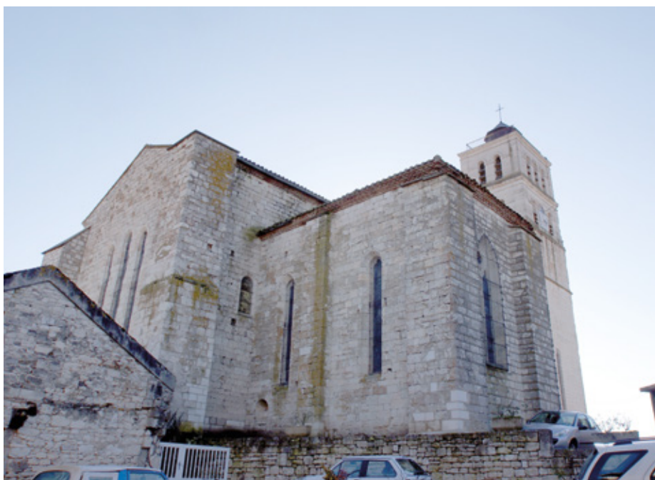
3. Vue nord-est du chevet

Les maçonneries en pierre de taille soigneusement assisées sont couronnées d'une génoise moderne ; les toitures sont en tuile canal. Le clocher, dont la partie haute est du xviii e siècle, a connu divers aménagements : il fut un temps couronné d'une coupole, puis d'une toiture à trois pans avec fronton, enfin, en 1998-1999, d'un édicule en cuivre sur le modèle de l'ancien clocher. Les glacis des contreforts ont été modifiés et surmontés de dalles en béton. On pénètre dans la nef unique par la porte principale, du xix e siècle, ou par l'une des portes latérales. Au sol, on relève la présence de pierres tombales des