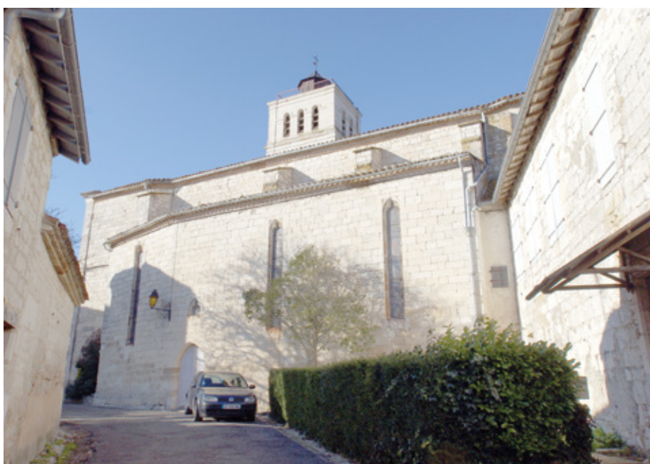
4. Façade sud

Le décor peint, entrepris avant 1853 et achevé par un élève des frères Pedoya, Henri Petit (1830-1906), de Verfeil en Tarn-et-Garonne, était constitué, sur les voûtes, d'arabesques, candélabres et rinceaux sur fond bleu azur dans un style néo-Renaissance et complété sur les murs de motifs au pochoir, avant sa réduction