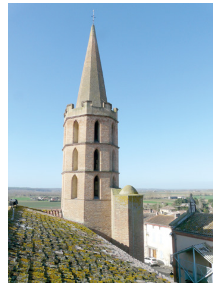
4. Couverture de la nef et du clocher après restauration