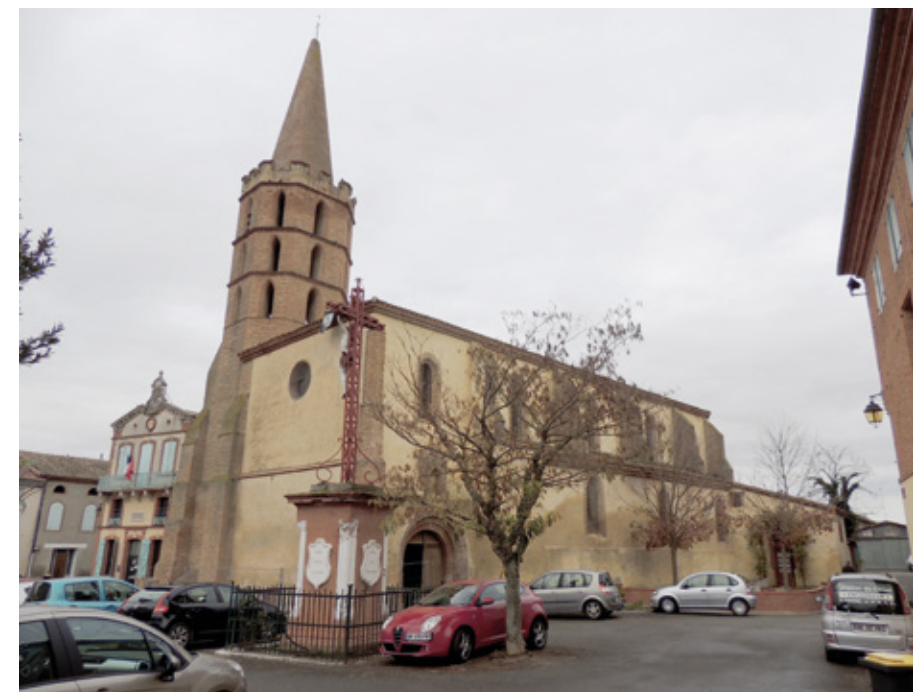
5. Façade sud-ouest

F. Moulenq, Documents historiques sur le Tarn-et-Garonne , Montauban, 1879-1894, t. I, p. 49 et t. IV, p. 121-123.