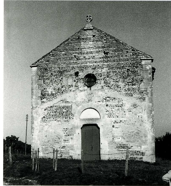
Saint-Trivier-sur-Moignans (Ain) Église Saint-Martin 1. Façade occidentale 2. Façade sud, chœur et abside

La façade est très sobre. Le portail, dépourvu de toute sculpture, comprend un linteau porté par deux corbeaux et protégé par un arc en plein cintre sans tympan. Jadis, une « galonnière » ou auvent, dont on voit la moraine, abritait l'entrée et occupait toute la largeur du mur ; le pignon, plus élevé que le faîtage de la nef, est terminé par une croix qui passe pour être carolingienne (romane ?). La nef,