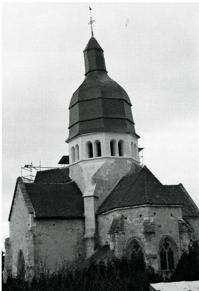
Saint-Victor (Allier). Église Saint-Victor. 1- Plan, éch. 0,005 (extrait du dossier d'inscription DRAC Auvergne). 2- Chevet et clocher vus de l'est.