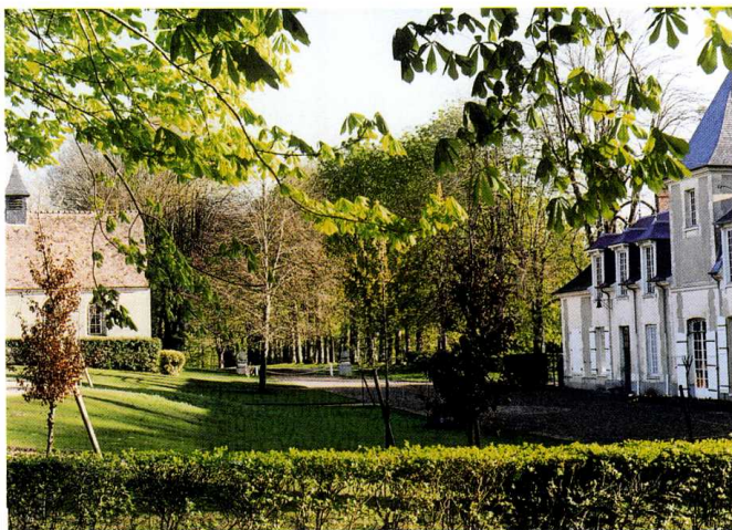
Sainte-Barbe-sur-Gaillon (Eure) Chapelle Saint-Vulfran de Courmoulin 1. Façade sud de la chapelle et château voisin voisin 2. Plan terrier