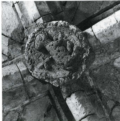
Sainte-Croix-à-Lauze (Alpes-de-Haute-Provence). Église Saint-Didier.

L'église a longtemps servi de dépotoir au cimetière tout proche. Son sauvetage a été entrepris en 1981 par l'association Alpes de Lumière, qui, avec l'aide de bénévoles, a débarrassé la nef des dépôts de terre et de la végétation qui l'avaient entièrement envahie. Mais il faut maintenant effectuer rapidement la réfection complète de la toiture du chœur et conforter la crête des murs gouttereaux de la nef. 20 000 F de subvention ont été accordés à cet effet par la Sauvegarde de l'Art français.