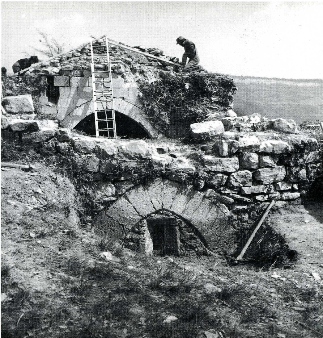
Sainte-Croix-à-Lauze (Alpes-de-Haute-Provence). Église Saint-Didier.