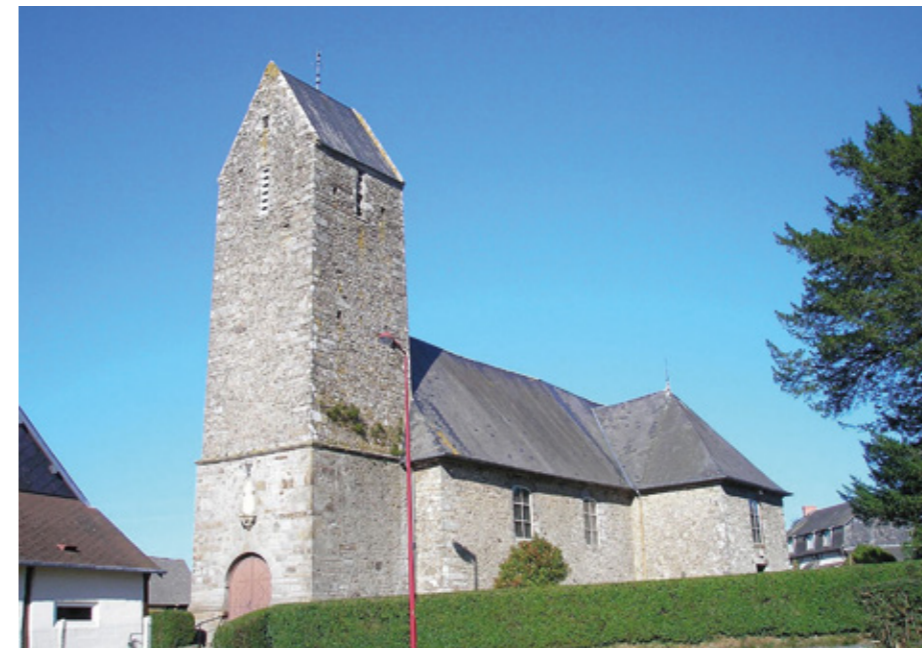
1. Vue sud-ouest