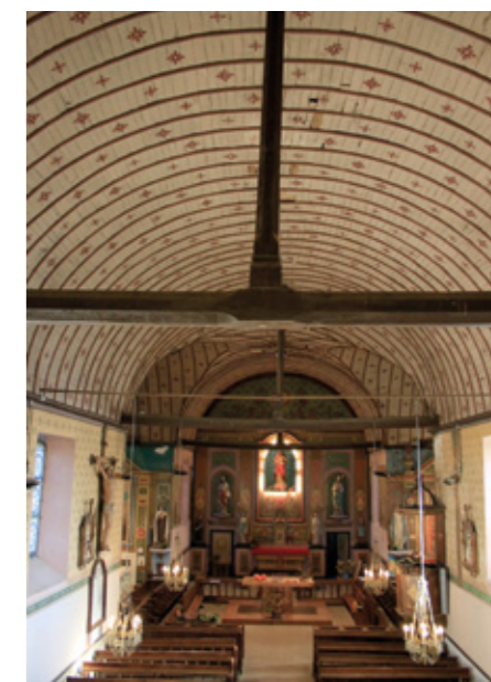
4. Voûte lambrissée en berceau

L'intérieur est couvert d'une voûte lambrissée en berceau. Les murs ont reçu en 1886 un décor peint ambitieux, avec des représentations de sainte Marguerite Alacoque devant le Sacré-Cœur, de Notre-Dame de Lourdes, de sainte Anne