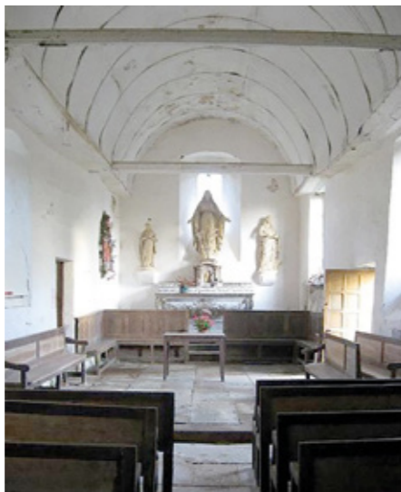
3. Vue intérieure vers le chœur

Elle a été remaniée au xv e siècle, comme en témoignent les traces d'anciennes ouvertures. Elle était à l'origine éclairée par des baies étroites et assez hautes de part et d'autre de la nef. L'une d'elles, au nord, fut obturée lors de la construction de la sacristie et transformée en niche à l'intérieur. Côté sud, la façade comptait trois baies agrandies pour apporter davantage de lumière. Le chevet est éclairé par une baie centrée ornée de moulurations. Le pignon occidental est aveugle, l'accès se faisant par deux portes percées dans la façade sud, l'une desservant la nef, l'autre le chœur.