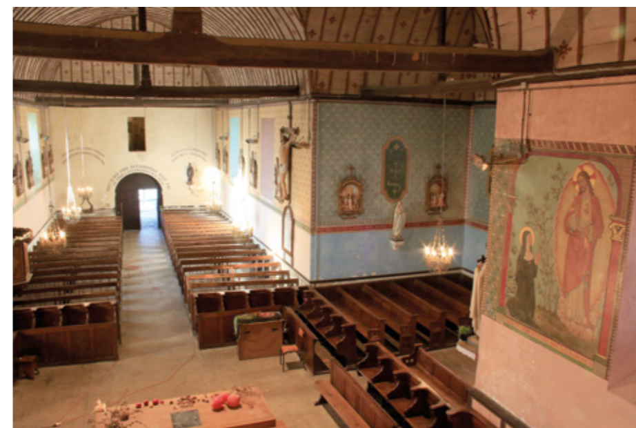
3. Vue intérieure vers l'entrée

De plan cruciforme, l'église est précédée d'un clocher-porche coiffé d'une toiture en bâtière. La nef compte quatre travées interrompues par un transept. Le chœur s'achève par un chevet à trois pans. Très peu de détails viennent atténuer la sévérité des moellons de granit et le gris des ardoises. Au-dessus du portail occidental en plein cintre subsiste une console qui accueillait la statue de saint Patrice, aujourd'hui mise à l'abri à l'intérieur. La façade nord est percée d'une porte dont les montants moulurés et le linteau sculpté d'un écu sont le réemploi d'une