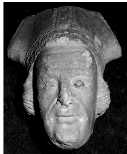
4. Tête de saint Malo évêque, xv e siècle

L'édifice renferme quelques éléments de mobilier inscrits au titre des monuments