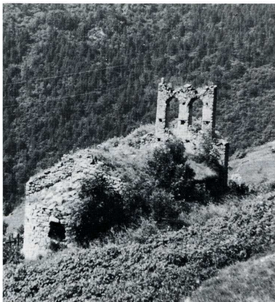
Sansa (Pyrénées-Orientales). Chapelle Saint-Jean-Baptiste.