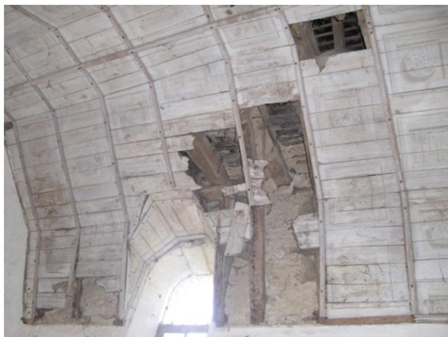
4. Voûte lambrissée ornée dans les caissons très effacés des instruments de la Passion