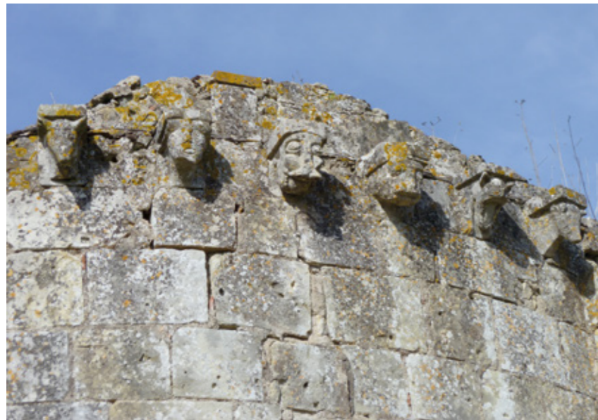
8. Modillons du chevet