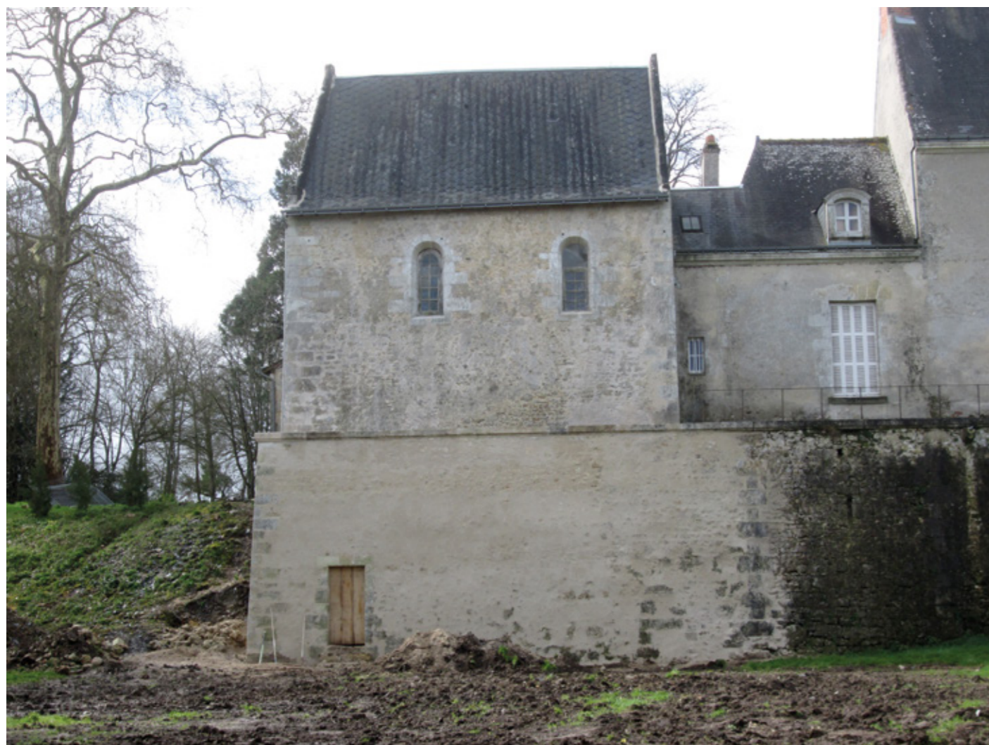
2. Façade nord de la chapelle