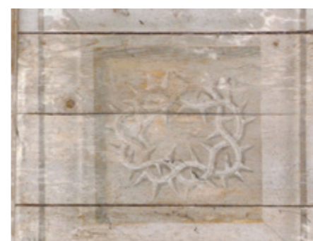
6. Détail de la voûte lambrissée : la couronne d'épines