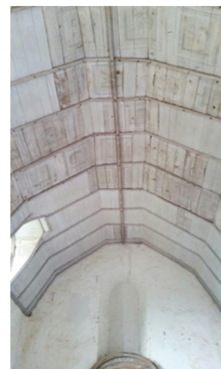
8. Voûte après restauration

l'est de deux autres. Une porte située dans le mur sud, au niveau de l'aile basse, permet l'accès à la chapelle ; une seconde, à l'ouest, est murée.