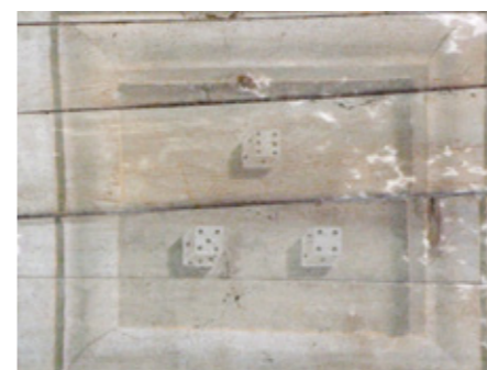
7. Détail de la voûte lambrissée : les dés