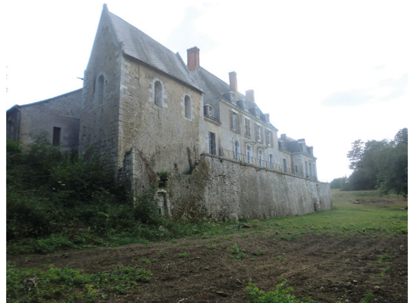
1. Vue nord-est de la chapelle et du château

Canton Château-Renault, arrondissement Chinon, propriété privée ISMH 2014