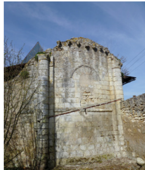
9. Chevet avant restauration

Arch. dép. Indre-et-Loire, 2 B 1319 : dossier d'informations de commodo et incommodo pour la suppression du monastère, 1762 (dont visite des lieux, 8-14 mars) ; 1 Q 45 : procès-verbal d'adjudication du lieu seigneurial et métairie, 12-30 sept. 1791.