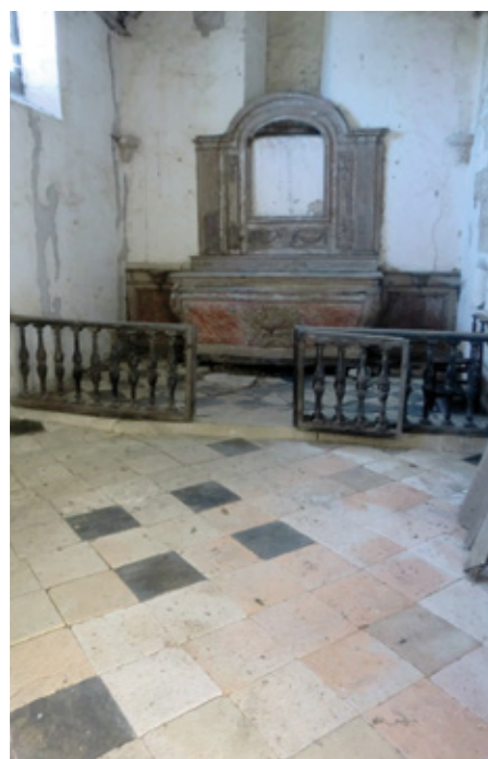
3. Vue intérieure vers le chœur