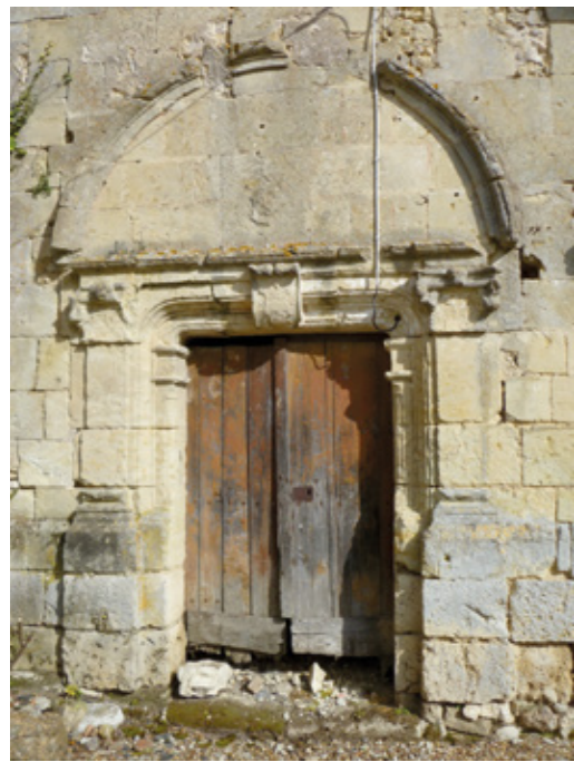
6. Un des portails sud