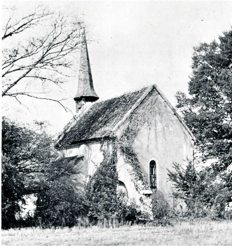
Serruelles (Cher). Église Saint-Ursin et plan de l'église.