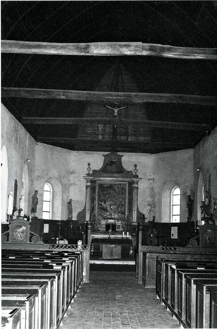
Soucy (Yonne). Église Saint-Étienne. Vue intérieure de l'église vers le chœur.

La partie supérieure a été complétée par une maçonnerie, afin d'installer aux angles quatre échauguettes en un encorbellement formant mâchicoulis. Une toiture recouvre le tout. Cette fortification du clocher qui devient le point fort d'un village se retrouve dans d'autres communes de la région dans la seconde moitié du XVI e siècle.