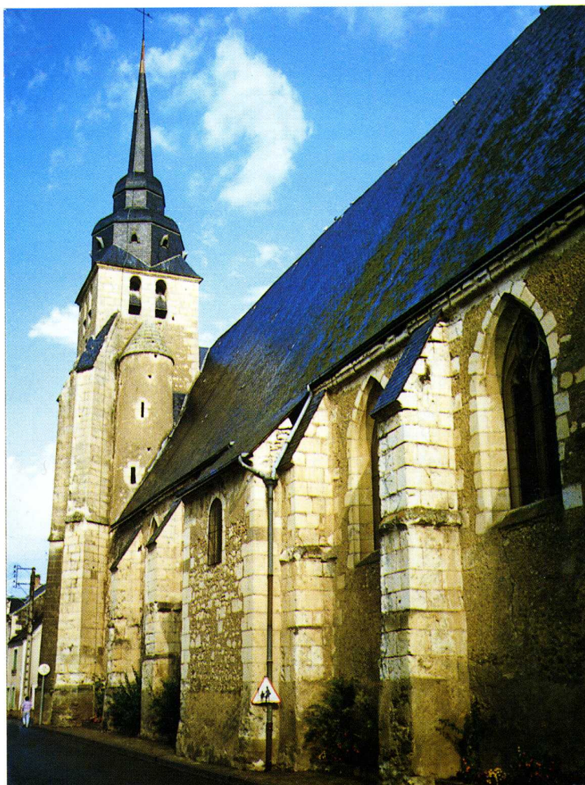
Sougé (Loir-et-Cher) Église Saint-Quentin Façade sud (cl. A. Gaston, P. Ponsot, arch.)

Son plan très simple consiste en une nef unique que surmonte un haut comble d'ardoise. Deux modestes chapelles ont été aménagées postérieurement à l'entrée du chœur entre les contreforts au nord et au sud. Le chevet plat est percé d'une baie à remplage flamboyant. La nef est éclairée au sud par des fenêtres au remplage plus simple. Le pignon occidental est dominé, au sud, par un haut clocher carré contrebouté par des contreforts. Les deux étages du beffroi, percés d'une et de deux ouvertures en plein cintre, sont couronnés par un double dôme de