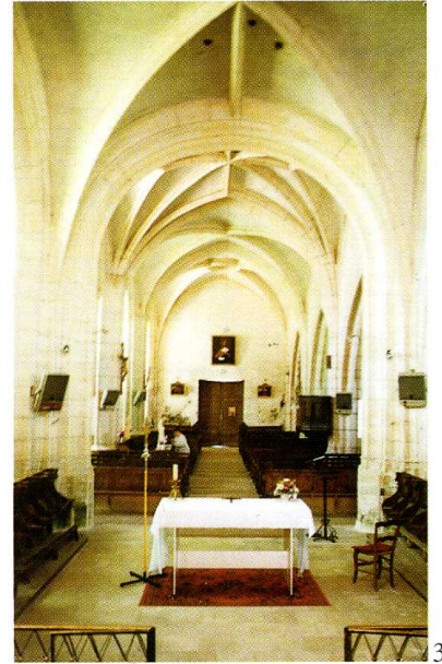
Sougères-en-Puisaye (Yonne) Église Saint-Pierre-et-Saint-Paul 1. Façade occidentale (H. Cazelles, arch.) 2. La nef vers le chœur 3. La nef vers l'ouest 4. Plan (H. Cazelles, arch.) 1996