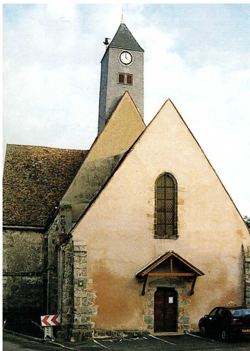
Soulaire (Eure-et-Loir) Église Saint-Jacques-et-Saint-Philippe Façade occidentale