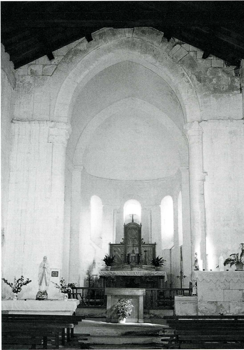
Tailliant (Charente-Maritime). Église Saint-Martin. Chœur.

au-dessus de la porte dont le plein cintre, surmonté d'un mince cordon sculpté en larmier est encadré de trois tores, s'ouvre une simple baie ébrasée et dénuée d'ornements. A l'intérieur, la charpente qui couvre la nef contraste avec la blancheur de l'enduit de la voûte du chœur et de l'abside en cul-de-four. A l'entrée du chœur, surélevé de trois marches, l'arc triomphal ne manque pas de grandeur ; les deux colonnes engagées qui le portent ont chacune un chapiteau historié.