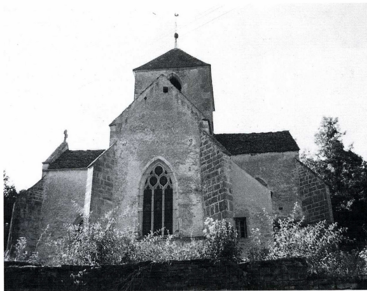
Talcy (Yonne). Église Saint-Pierre et Saint-Paul, chevet.

L'édifice construit au XV e s. comporte une nef unique voûtée d'ogives. Le chœur et les croisillons du transept sont voûtés avec liernes et tiercerons. Les ogives retombent sur des culots sculptés, ceux du chevet plat représentent saint Pierre et saint Paul. L'église possède également un portail Renaissance. Des éléments d'un décor peint du XVI e s. subsistent dans le croisillon sud du transept.