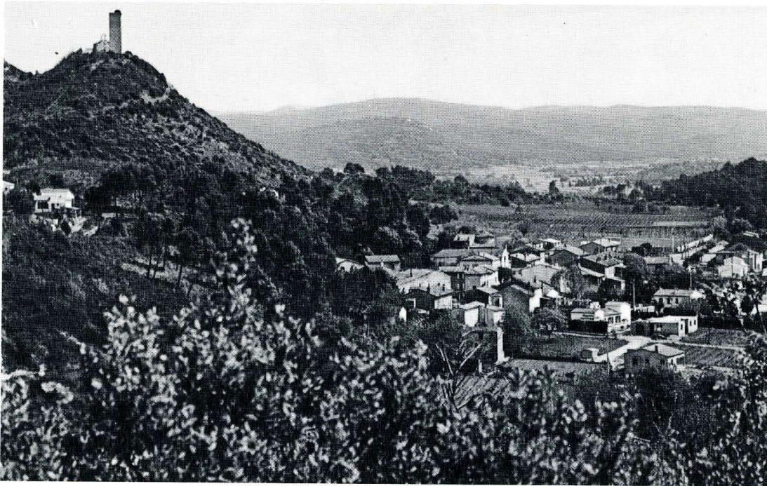
Taradeau (Var). Chapelle de la Tour.