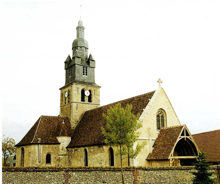
Thibivillers (Oise) Église Saint-Pierre 1. Façade sud et ouest de l'église 2. Plan (Ph. Charron, ABF, 1999)