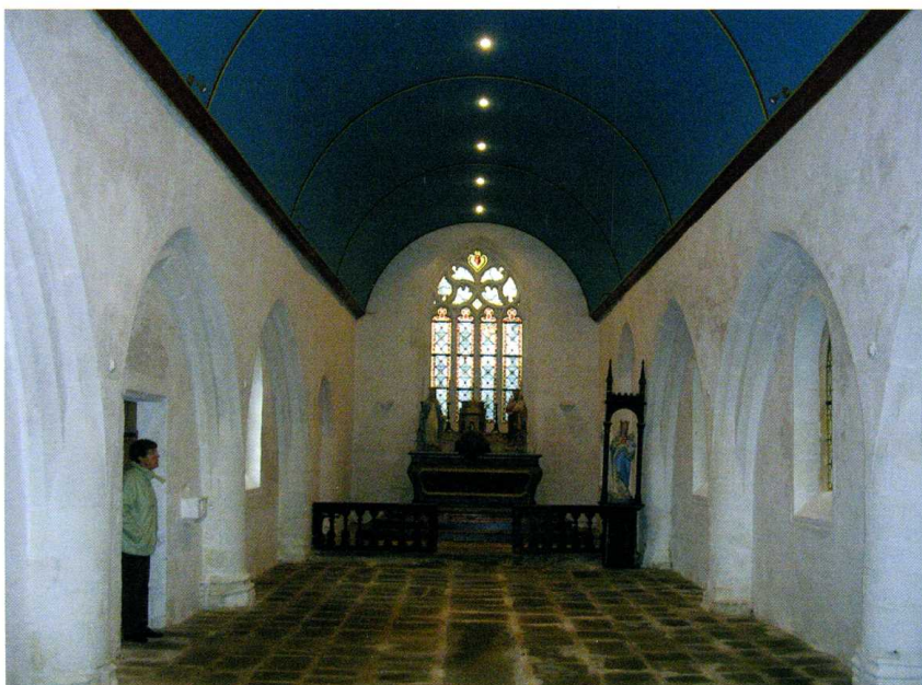
Trébabu (Finistère) Chapelle Notre-Dame-du-Traon 4. Vue intérieure

L. Le Guennec, Le Finistère monumental , t. II, Brest et sa région , Quimper, 1981, p. 181.