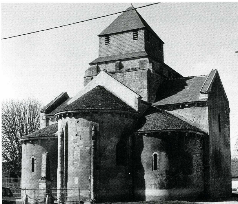
Tresnay (Nièvre), Église Saint-Rémi, chevet (photo de P. de Maulmin).