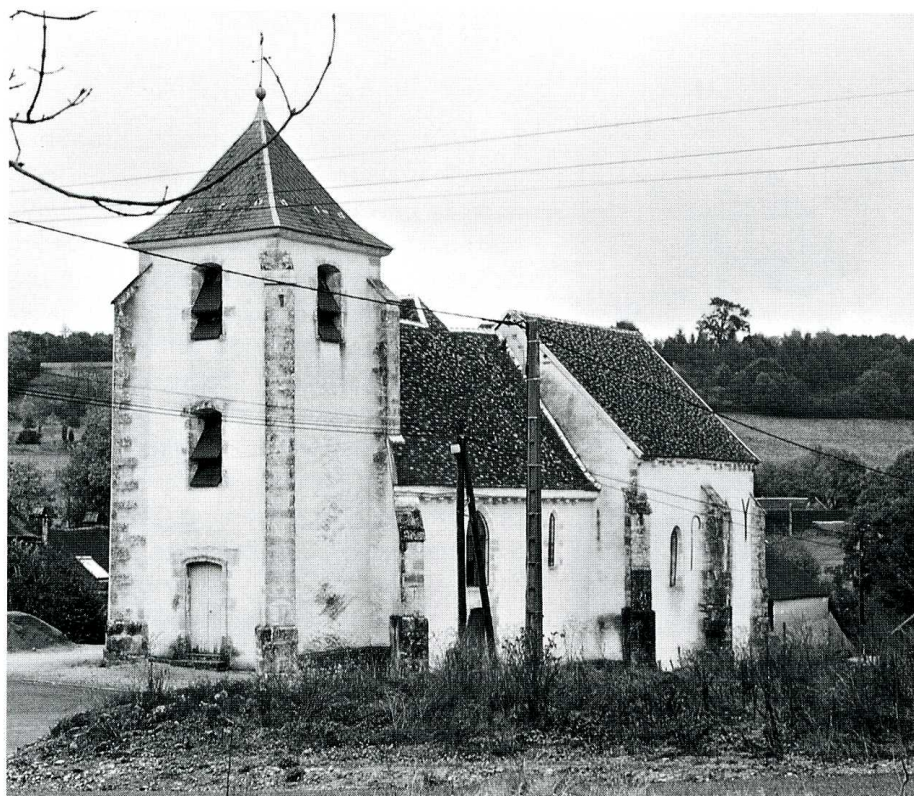
Trichey (Yonne). Église Saint-Aventin. 1- Plan (B. Colette A.C.M.H.). 2- Vue générale de l'église du sud-ouest.