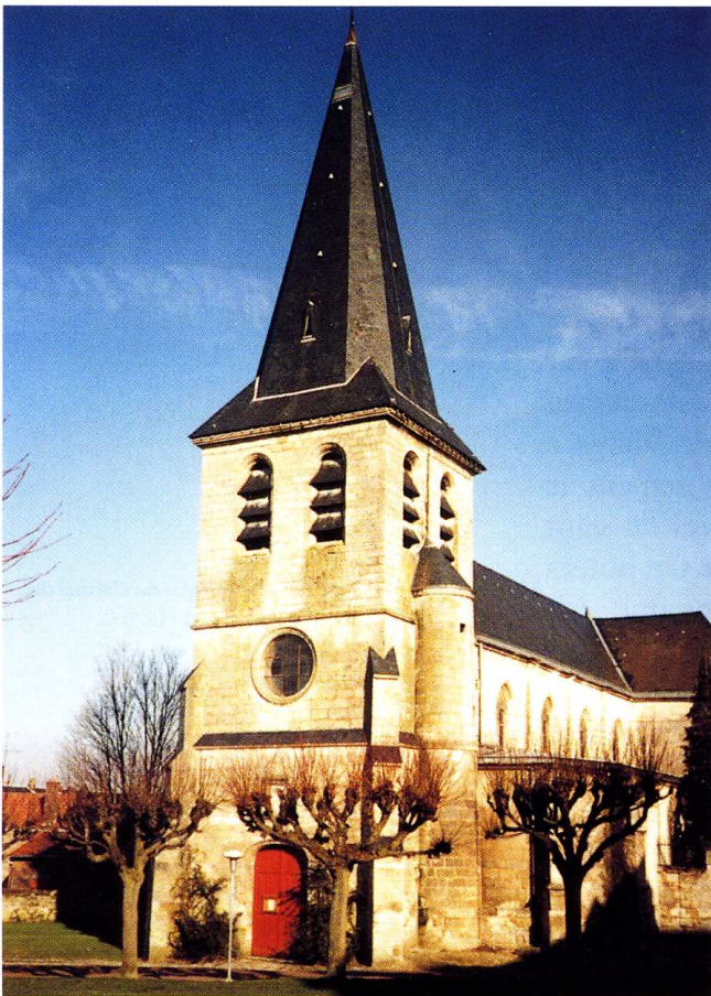
Trosly-Loire (Aisne) Église Saint-Pierre 1. Façade occidentale 2. Portail occidental

Saint-Pierre de Trosly, endommagée au cours de la guerre de Cent Ans, aurait été reconstruite dans le dernier quart du XV e s., si l'on en croit l'inscription gravée sur une plaque du XIX e s., posée à l'angle nord-ouest du bras nord du transept qui mentionne la date de 1478 pour l'achèvement des travaux. En fait, les restaurations semblent avoir été bien plus tardives puisque la clef de voûte du chœur, disparue au cours de la première guerre mondiale, portait la date de 1552.