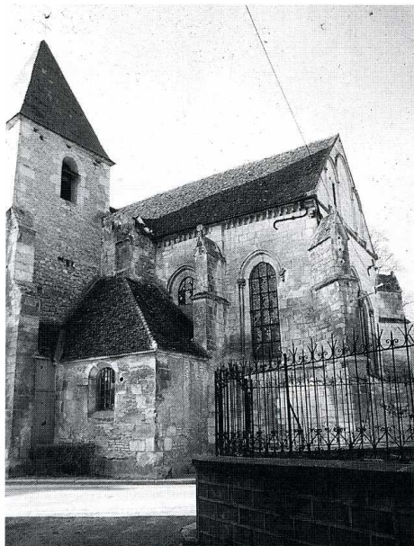
Val-de-Mercy (Yonne). Église Saint-Aubin, façades sud et est du chœur.

(Yonne, canton de Coulanges-la-Vineuse, arrond. d'Auxerre, 305 hab.)