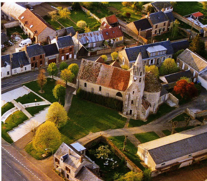
Viabon (Eure-et-Loir) Église Saint-Martin 1. Vue à vol d'oiseau côté sud