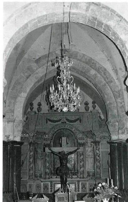
Viels-Maisons (Aisne). Église Sainte-Croix, clocher et intérieur du chœur.

L'Église paroissiale Sainte-Croix a conservé du XII e s. une travée de chœur actuellement à chevet plat et le carré d'un transept dont les piles renforcées de colonnes engagées ornées de chapiteaux romans supportent une tour massive. Les ouvertures géminées de ce clocher, deux sur chaque face, ont été en partie murées dans leur partie basse. Les bras du transept, la nef et ses bas-côtés, ont été remaniés au XVI e et au XIX e s. Protégé par un porche, s'ouvre à l'ouest un élégant portail double de la seconde renaissance : trois colonnes cannelées de style toscan portent un entablement à triglyphes et métopes. Un bel ensemble de boiseries du XVIII e s. meuble le chœur et ses abords. La Sauvegarde de l'Art Français a accordé une aide de 50 000 F en 1991 pour réparer la couverture du clocher.