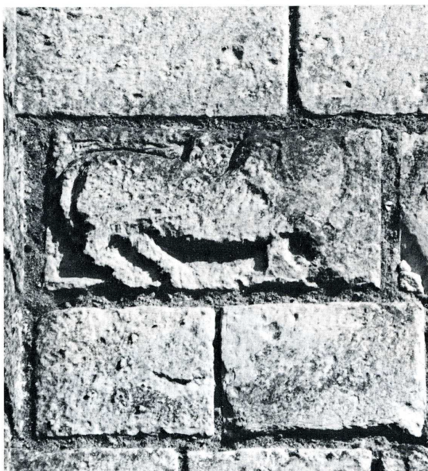
Villentrois (Indre). Ancienne église de Saint-Mandé.