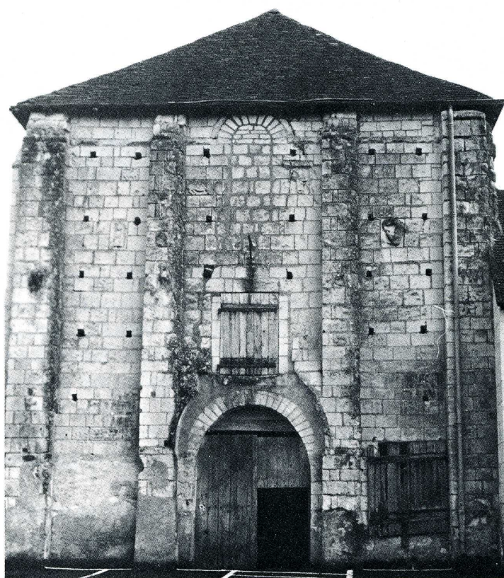
Villentris (Indre). Ancienne église de Saint-Mandé.