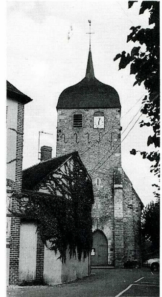
Villiers-Saint-Benoît (Yonne). Église Saint-Benoît plan et façade occidentale.

P rieuré de Saint-Benoît-sur-Loire depuis le x e s., sa possession fut confirmée aux bénédictins après de nombreux conflits avec les seigneurs voisins, en 1147. La construction de l'église actuelle a, sans doute, été commencée peu après cette date. Les vestiges d'un édifice antérieur ont été retrouvés le long du mur nord. Précédée à l'ouest par un clocher-porche massif surmonté d'un bulbe aplati à quatre nervures (transformation en 1740), la nef unique est couverte d'une voûte en bois. Elle se termine par un chevet plat, autrefois éclairé à l'est par une fenêtre ogivale dont on peut voir le sommet et une partie de ses remplages à l'extérieur au-dessus du toit de la sacristie moderne. Elle est cachée dans le chœur par un beau retable du xvii e s. En outre, l'église possède un intéressant bas-relief en pierre polychrome du xvi e s., représentant la « vision de saint Hubert », trois statues du xvii e s., sainte Anne, saint Jean-Baptiste, saint Benoît et un saint Sébastien, toile du xviii e s. En 1902, au cours d'une restauration, on a découvert sur le mur nord des peintures murales du xv e s. qui ont été classées Monuments historiques. Leur thème est « le dit des trois morts et des trois vifs ». Pour la réfection de la charpente et de la toiture de l'église, la Sauvegarde de l'Art Français a accordé une subvention de 30 000 F en 1989 et une seconde subvention de 25 000 F en 1993.