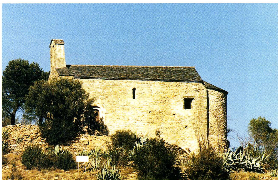
Vinça (Pyrénées-Orientales) Chapelle Saint-Pierre de Bell Lloch 1. Façade occidentale 2. Façade sud avant travaux 3. Façade sud après travaux