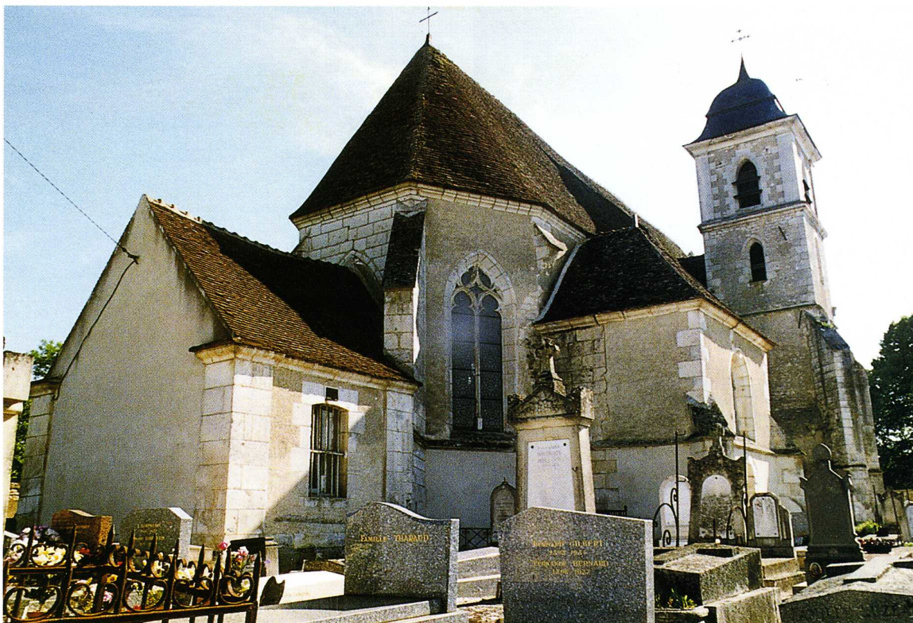
Vincelottes (Yonne) Église Saint-Martin Vue du chevet 1996

Yonne, canton Coulanges-la-Vineuse, arrondissement Auxerre, 286 habitants