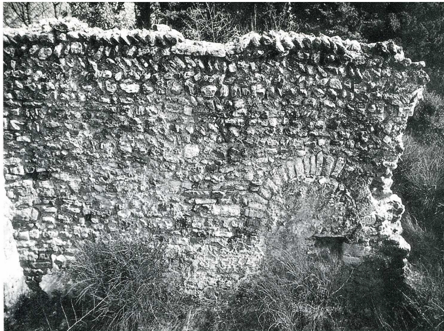
Visan (Vaucluse). Chapelle Saint-Vincent.

La Sauvegarde de l'Art Français a versé une aide de 10 000 F pour protéger cet intéressant édifice sur lequel des travaux de maçonnerie et couverture importants ont été entrepris par la suite.