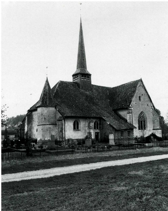
Yèvres-le-Petit (Aube). Église Saint-Laurent, vue d'ensemble côté sud-ouest.

Aube, canton de Brienne-le-Château, arrond. de Bar-sur-Aube, 59 hab.