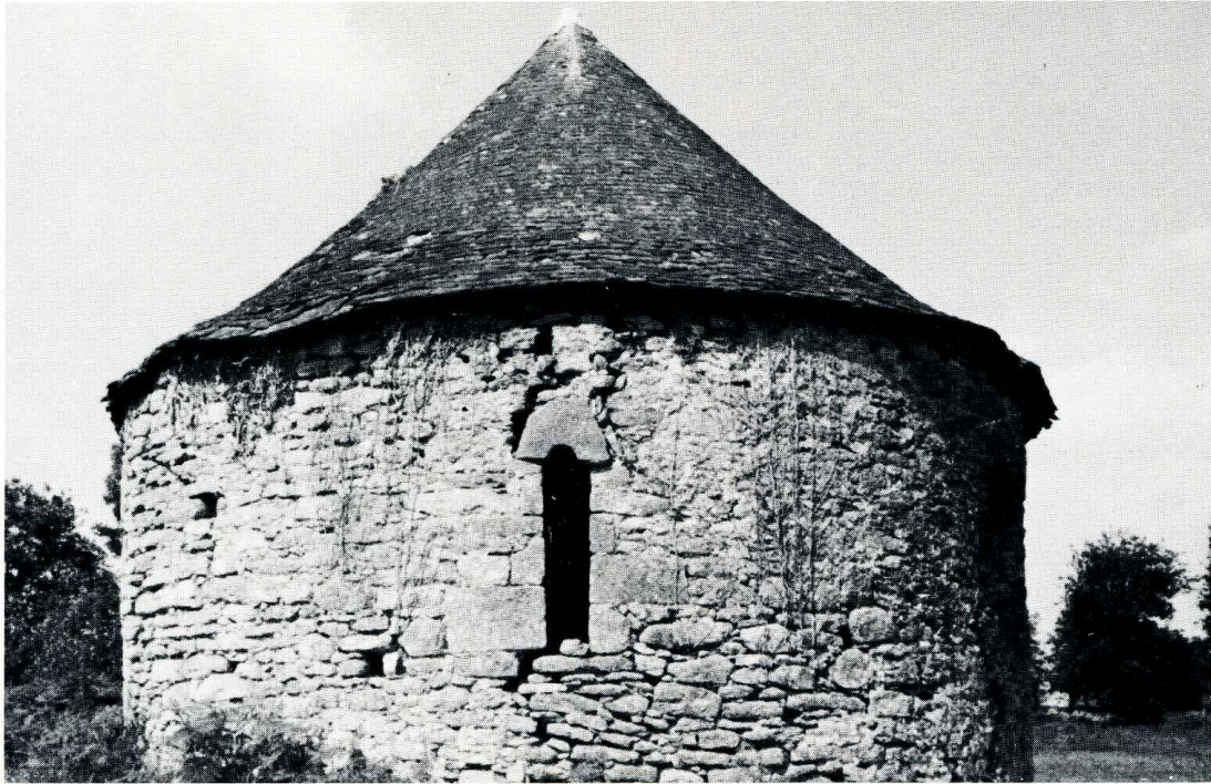
Yvignac (Côtes-du-Nord). Chapelle de Lannouée.